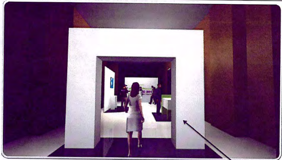
Pórtico de Bienvenida de 1x3mts de altura